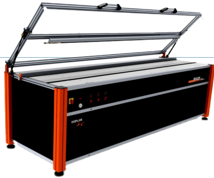
Plegadora de metacrilato RGP MOD 150