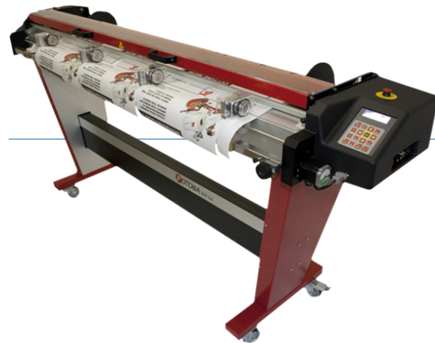
Cortadora automática Fotoba WR 64