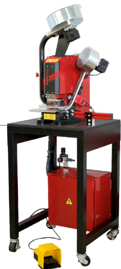
Olladora automática Plastgomet Autocross