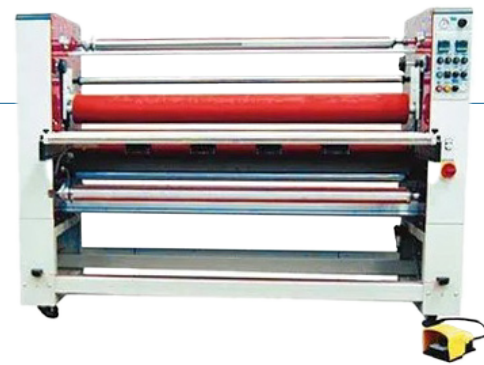
Laminadora encapsuladora Neschen Jetlam 1.6TH