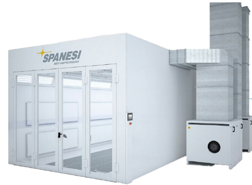
CABINA DE PINTURA OGA SPANESI